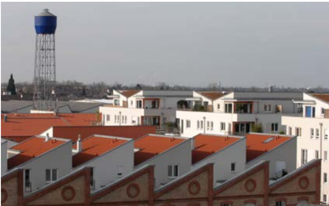
Im Quartier am Turm prägen die alten Hallenfassaden die einzigartige Architektur, die als Silhouette bei einem Teil der Neubauten aufgegriffen wurde. Die historischen Mauern zeugen mit dem alten Wasserturm heute noch von der industriellen Vergangenheit des Geländes

Mit der Internationalen Gesamtschule IGH südlich des Quartiers und der Eichendorff-Schule im Kern Rohrbachs liegen zwei Schulen in gut erreichbarer Entfernung. Dabei hat die spezielle Einwohnerzusammensetzung des Quartiers ihre Besonderheit. Mit ihrer hohen Anzahl von Akademikern in hochqualifizierten Berufen nutzen sie für ihre Kinder gerne die unterschiedlichen Angebote von den Höheren Schulen. Auch hier ist die Versorgung in Heidelberg gut. Das Englische Institut EI ist noch zu Fuß zu erreichen. In unmittelbarer Nachbarschaft steht der größte Sportverein Heidelbergs, die Turn- und Sportgemeinde TSG Rohrbach allen offen. Mit dem vereinseigenen Gesundheits- und Fitnessstudio FITropolis spricht es gesundheitsbewusste Bevölkerungsgruppen an, die eine in