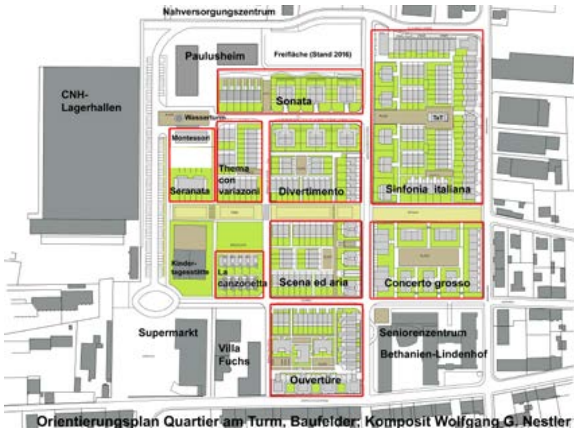
Die Namen der Baufelder im Orientierungsplan geben eine Vorstellung von der Absicht, im Quartier am Turm musikinspiriert zu Bauen

Auf der Suche nach gültigen Vorbildern für architektonisches Wirken ist die Musik in vielen Epochen zur Quelle der Inspiration geworden. Die strukturellen Analogien zwischen den Disziplinen sind zahlreich und umfassen die Möglichkeiten der synergetischen Umsetzung aller wesentlichen Bereiche der architektonischen Gestaltungen: Form der Baukörper, Gebäudeprofil und Raumkonturen, Komposition der Fassadenfläche durch Fenster, Farb- und Materialgestaltung und mehr. Die architektonische